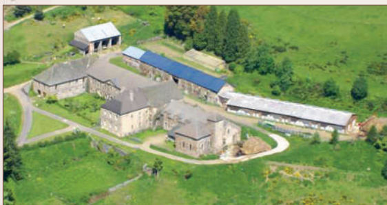
L'abbaye de Mercoire

gine sur le promontoire, il s'installa, à partir du XIX e siècle au pied du rocher et devint commune en 1888 par détachement de la commune de Chaudeyrac. En haut du rocher, à l'emplacement de l'ancien château-fort, la chapelle dédiée à Notre-Dame-de-toutes-Grâces offre une vue magnifique sur le village et la forêt. L'église paroissiale, du XIX e siècle, est à signaler car son clocher provient de l'abbaye des Dames de Mercoire et date du XII e siècle.