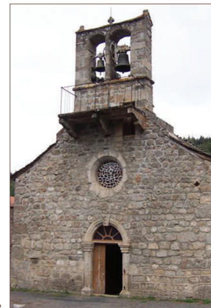
L'église de Cheylard-l'Évêque